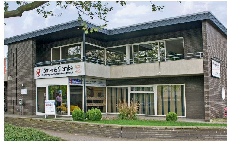
Zentrumsnah und mit Parkplätzen ausgestattet: Das Versicherungsbüro in der Husarenstraße 11.

Das eingespielte Mitarbeiterteam freut sich über den besonderen runden Geburtstag. Auf die Kundschaft wartet ein kleines Bonbon: „Zu unserem 50-jährigen Bestehen haben wir für jeden Kunden, der sich für eine Berufsunfähigkeits- oder Pflegeversicherung interessiert und einen Vertragsabschluss tätigt, eine Jubiläums-Überraschung parat“, kündigen die beiden Versicherungs- und Vorsorgespezialisten an. „Die Berufsunfähigkeitsabsicherung ist aktuell wieder für alle Studenten und Berufsstar-